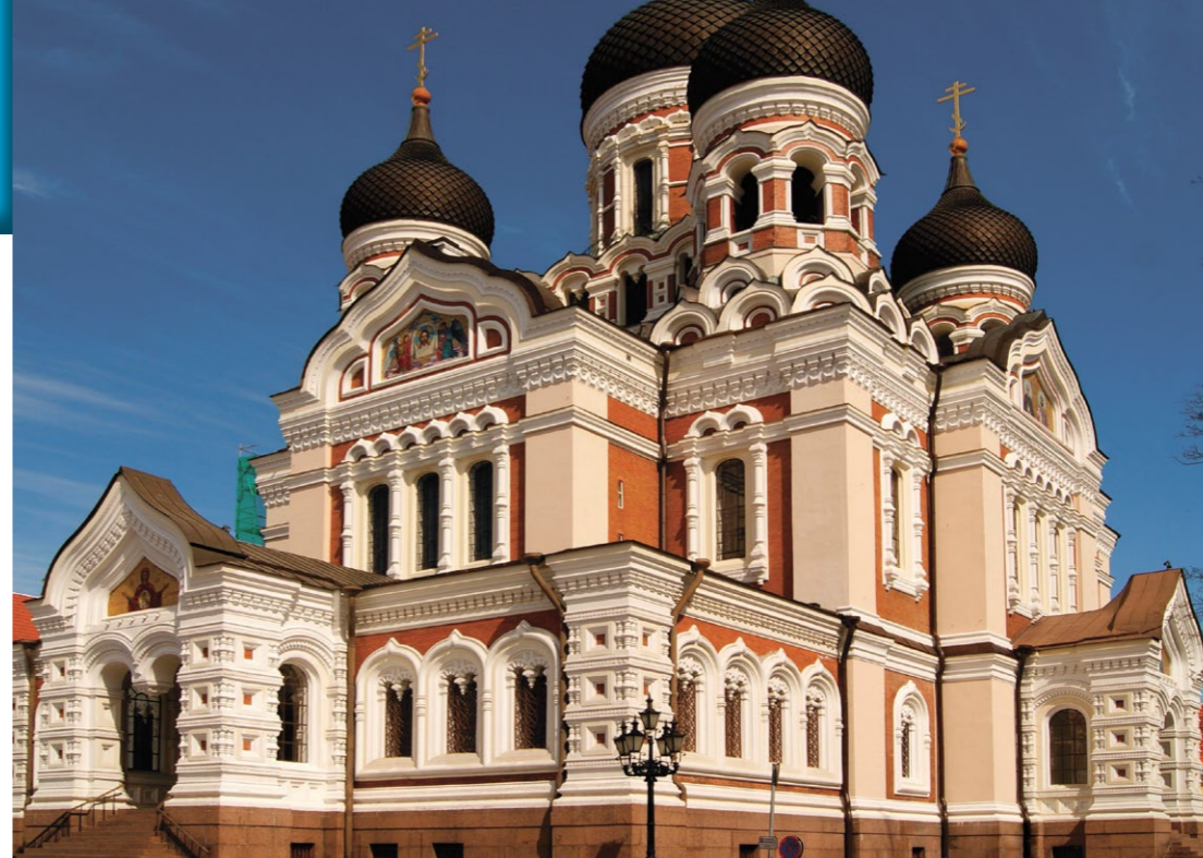
Aleksander Nevski katedraal valmis 1900. aastal. See ehitati otse Toompea lossi vastu.

venestamist ehk venepäraseks muutmist. Eestisse rajati mitmeid õigeusu kirikuid, millest üks tuntumaid on Tallinnas Toompeal paiknev 1900. aastal valminud Aleksander Nevski katedraal. Lisaks hakati sel ajal koolides õpetama vene keeles. Näiteks toimub Oskar Lutsu „Kevade“ tegevus 19. ja 20. sajandi vahetusel ning peategelasel Joosep Tootsil on hirmus raske koolis õpetatavat materjali mõista, sest õppetöö oli venekeelne. Nii saab Toots alles hiljem koolikaaslastelt teada, et maa-ainera on tegelikult ümmargune, kuna ainetunnis ta õpetaja venekeelset selgust ei mõistnud.