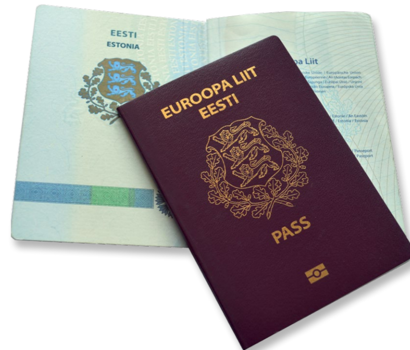
Eesti Vabariigi pass.

kodanikud kasutada reisidokumendina ka ID-kaarti. ID-kaart ehk isikutunnistus on eestlase jaoks kohustuslik alates 15. eluaastast, see on Eesti kodaniku ja Eestis püsivalt elava Euroopa Liidu kodaniku isikutõendav dokument. ID-kaarti saab kasutada nii tavapäraseks isiku tõendamiseks kui ka enda tuvastamiseks elektroonilises keskkonnas, aga ka digitaalallkirja andmiseks. Seega on väga oluline, et ID-kaart ning selle paroolid ei satuks mitte kunagi kellegi teise kätte.