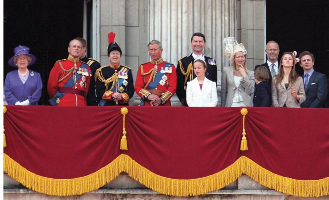
Briti kuninglik perekond Buckinghami palee balkonil. Kuninganna Elizabeth II on ainus monarh maailmas, kes on samal ajal rohkem kui ühe iseseisva riigi pea.

Sõnad kuningriik , monarhia või vabariik ei näita alati ära, kas tegu on demokraatliku või ebademokraatliku riigiga. Selleks tuleb vaadata, kas parlamendivalimised on demokraatlikud, kas ajakirjandus on vaba, kas austatakse inimeste võrdõigussuhteid ning usuliselt toekspidamisi.